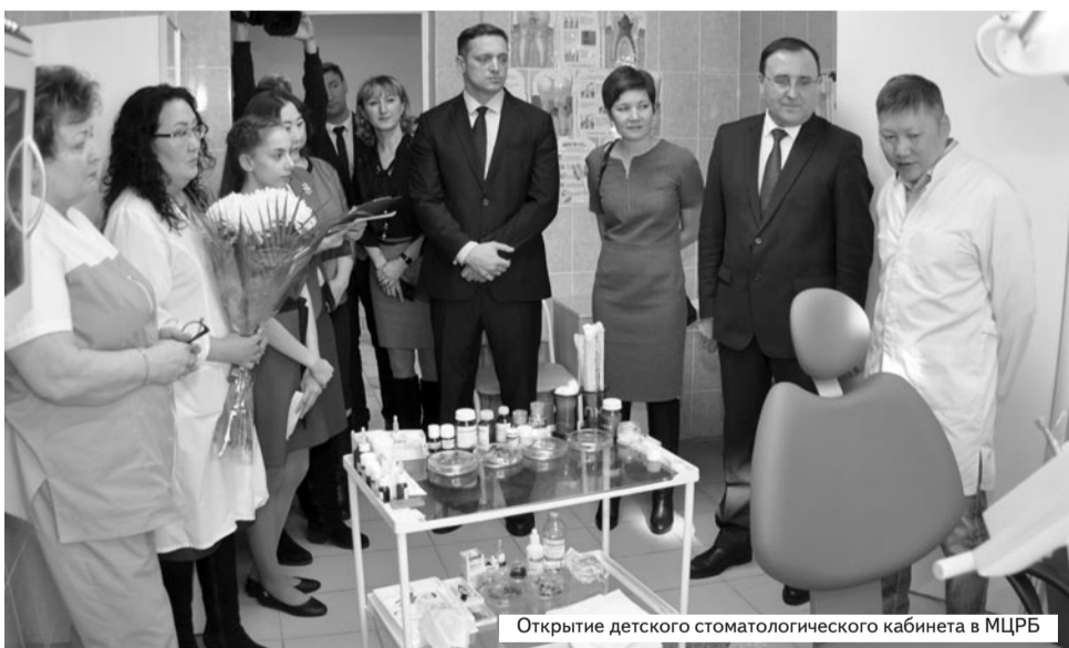
Открытие детского стоматологического кабинета в МЦРБ

Мероприятия по созданию условий для привлечения и закрепления медицинских кадров реализуются также в рамках программы «Обеспечение жильем работников бюджетной сферы».