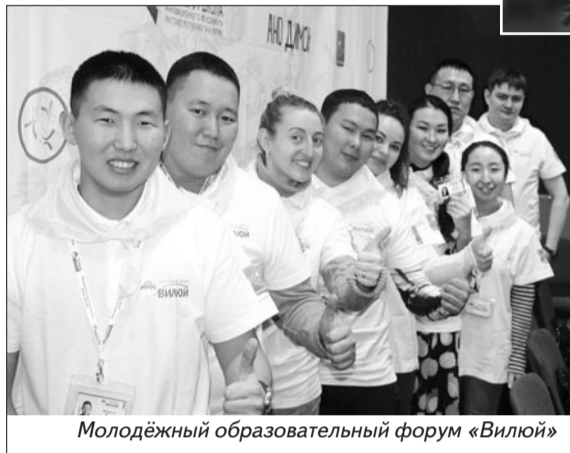
Молодёжный образовательный форум «Виллюй»

В январе прошёл республиканский турнир по борьбе хапсагай памяти первого мастера