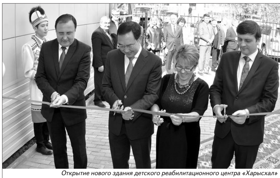
Открытие нового здания детского реабилитационного центра «Харысхал»

В августе 2018 года в детском саду №8 «Чопууска» открылся оздоровительный центр для детей-инвалидов и детей с ограниченными возможностями здоровья.