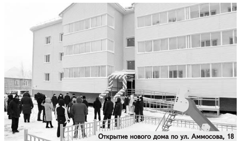
Открытие нового дома по ул. Аммосова, 18

Юлия ТУМАНОВА.