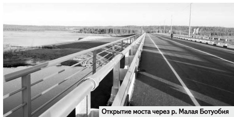
Открытие моста через р. Малая Ботубобия

В этом году совместно со специалистами компании «АЛРОСА», правительством РС(Я), администрациями МО «Мирнинский район» и поселка создана рабочая группа, актуализирующая возникающие вопросы. АК «АЛРОСА» подготовлено три возможных сценария развития событий в прогнозных рамках до 2030 года. Условно их можно назвать, как: нейтральный, негативный и позитивный. Стоит отметить, что по всем трем вариантам до 2025 года уменьшения численности работников Айхальского ГОКа не запланировано. Даже есть незначительное увеличение численности сотрудников в этот временной период. И никакое серьезное сокращение социальной сферы