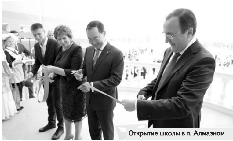
Открытие школы в п. Алмазном